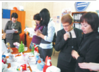
Подведение итогов конкурса "Сказки из ниток", 2010

Комиссия оказывала помощь женщинам и их детям в направлении на лечение, санаторно-курортное лечение. По ходатайству