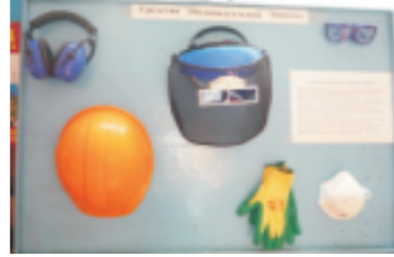
СИЗ на стенде по ОТ Аглодоменного цеха

сооружений от наледей и сверхнормативных накопленний снега (ежегодно); - обеспечения мер безопасности с ручным электрифицированным инструментом (в 2009г.); - перевозки автотранспортом по территории завода опасных грузов (в 2009г.); - проведения ремонта газорезательной аппаратуры в подразделениях завода (в 5 подразделениях в 2009г.); - проведения периодического медицинского осмотра работников, включая углубленный медицинский осмотр