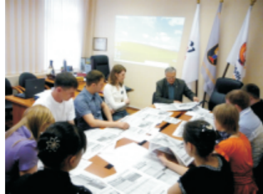
Молодежное совещание по аттестации рабочих мест, 2011

В 2008 году молодежной комиссией впервые было разработано Положение и