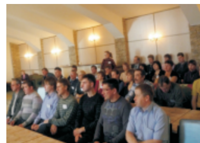
Семинар уполномоченных по охране труда, 2011