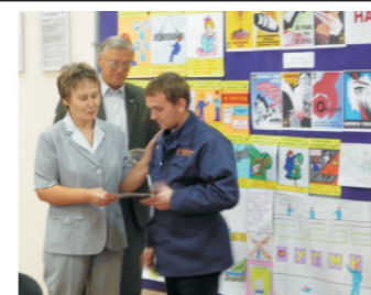
Конкурс плакатов по охране труда, 2009

Большое внимание уделяется непосредственному общению с профактивом. Как и прежде продолжилась работа с профгруппами подразделений. Опробованная в прошлый отчетный период форма «круглый стол» регулярно использовалась и в эти четыре года. Всего организовано и проведено 19 «круглых столов» профгруппов с председателем и специалистом профкома. Обсуждаемые темы: ситуация на предприятии, вопросы заработной платы, исполнения колдоговора, охраны труда, питания, оздоровления работников и т.п. Совместно с комиссией профкома по работе с молодежью была внедрена новая форма информирования и работы с молодежным профактивом подразделений - «информационные совещания в формате семинара» (более подробно о данном направлении изложено в отчете комиссии профкома по работе с молодежью).