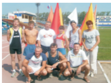
Спартакиада Свердловского обкома ГМПР, 2010

Пожелание на новый период: восстановление заводской спартакиады в полном объеме и более тесное сотрудничество председателей цехкомов и физоргов.