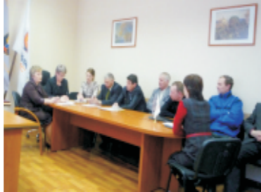
Заседание профсоюзного комитета

сией были подготовлены для рассмотрения на заседаниях профсоюзного комитета следующие вопросы: