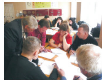
Семинар председателей профкомов цехов, 2011