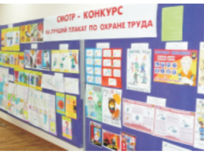
Конкурс на лучший плакат по охране труда, 2009