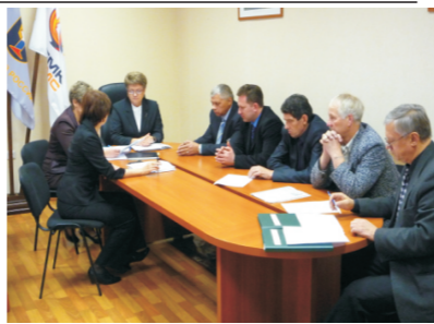
Заседание профкома о работе комиссии по труду и зарплате, 2011

По инициативе комиссии профкома по труду и заработной плате для оперативного разрешения спорных вопросов и формирования предложений по совершенствованию системы оплаты труда создана совместная комиссия по заработной плате на паритетной основе (в т.ч. 3 представителя комиссии профкома).